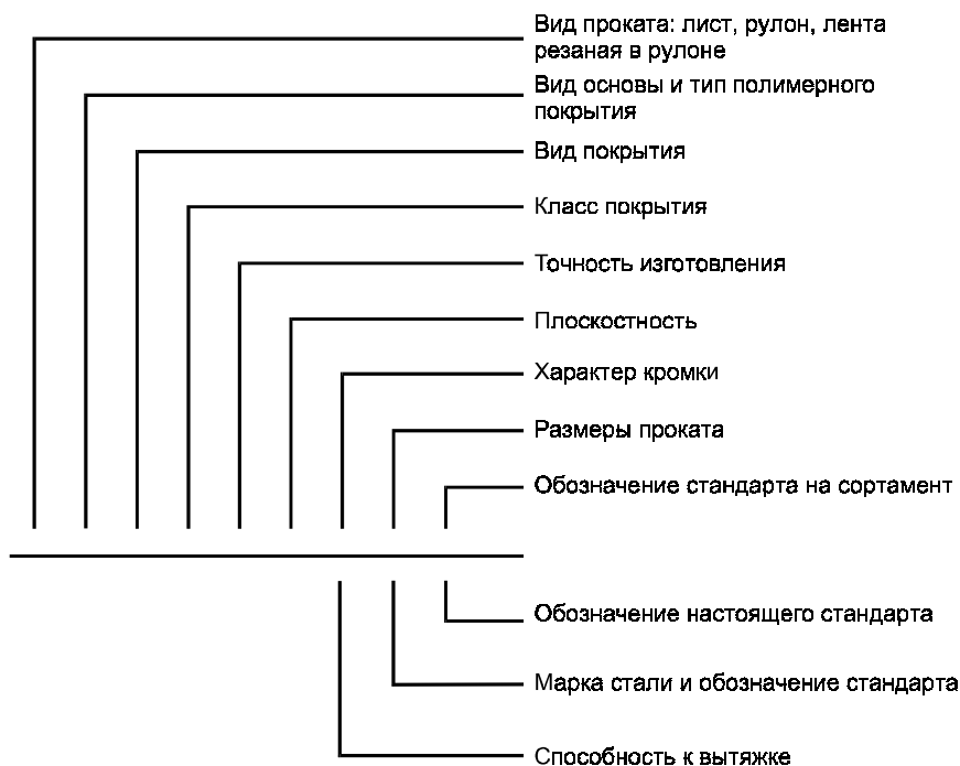
Схема условных обозначений проката с полимерным покрытием

П р и м е ч а н и е — При отсутствии какого-либо из параметров его выбирает предприятие-изготовитель.